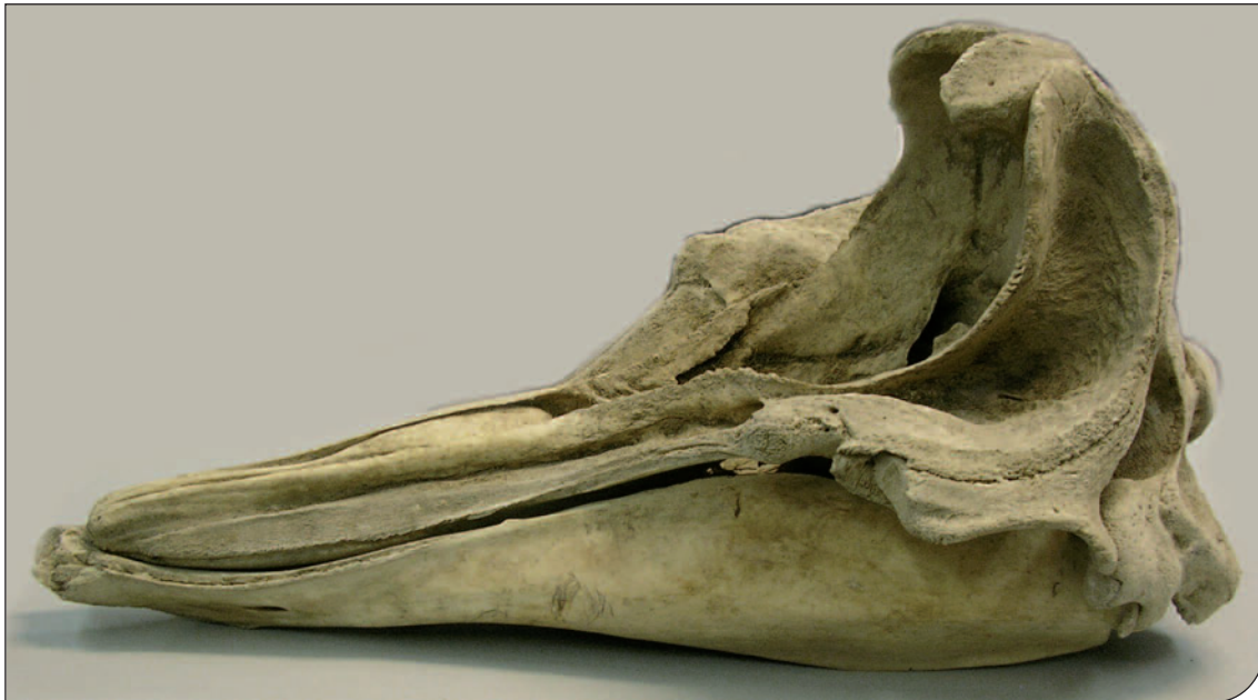
Fig. 2. "Cranio dello Zifio spiaggiato nel Mar Grande di Taranto negli anni '50-'60 conservato presso l'Istituto Talassografico "A. Cerruti" di Taranto.

Famiglia Delphinidae Gray, 1821 Grampus Gray, 1828 Grampus griseus (Cuvier, 1812) Grampo Risso's Dolphin