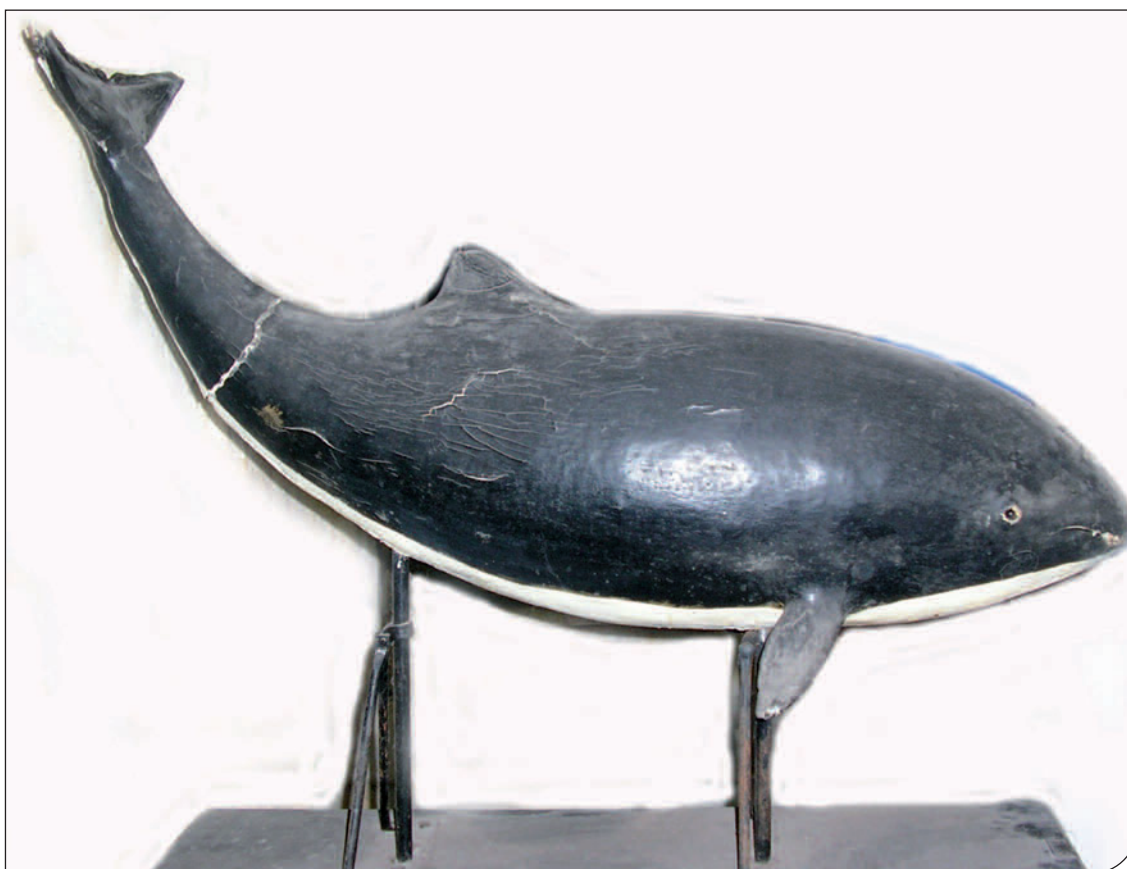
Fig. 3. Esemplare tassidermizzato di Focena comune conservato presso l'Istituto Talassografico "A. Cerruti" di Taranto.

La piccola collezione osteologica di cetacei del museo, in ottimo stato di conservazione, è composta da 5 scheletri montati completi. I reperti sono collocati in una delle sale dedicate al mare, 4 di essi posizionati in una vetrina centrale e quindi ben visibili su tutti i lati. Essi rappresentano la principale attrazione