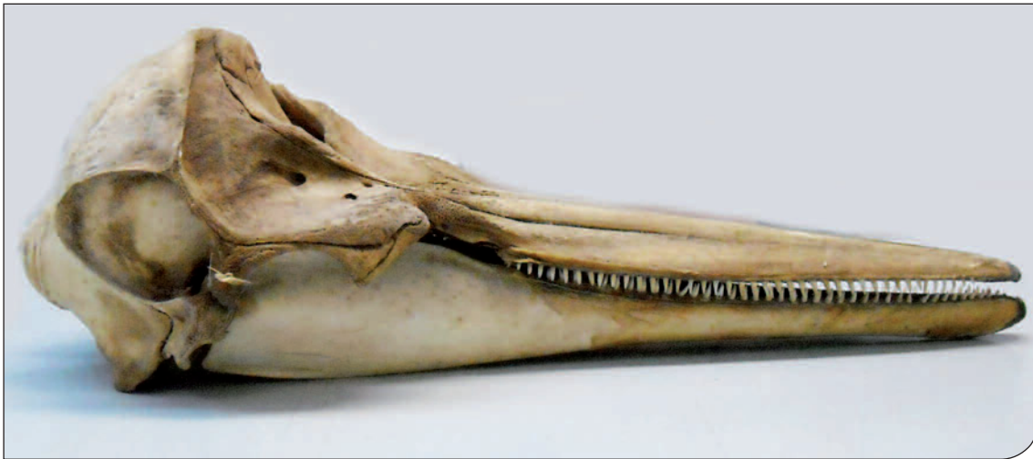
Fig. 1. Cranio del Delfino comune conservato presso il Liceo Scientifico "Cosimo De Giorgi" di Lecce preparato da Liborio Salomi verso la fine degli anni '20.

e ecologia) e il Dipartimento di Medicina Veterinaria, dell'Università di Bari Aldo Moro, il Museo Naturalistico "Vincenzo De Romita" dell'Istituto Tecnico per Geometri "Pitagora" di Bari e il Museo di Storia Naturale della Provincia di Foggia.